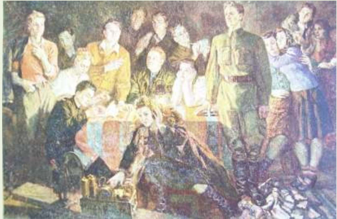
П. Соколов-Сакля. Краснодонцы. 1948

Сталинская премия третьей степени (1949)