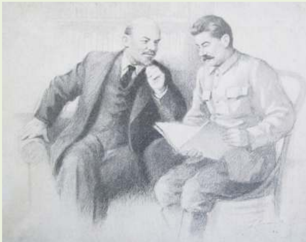
П.Васильев. В.И.Ленин и И.В.Сталин. Цв. карандаш. 1946