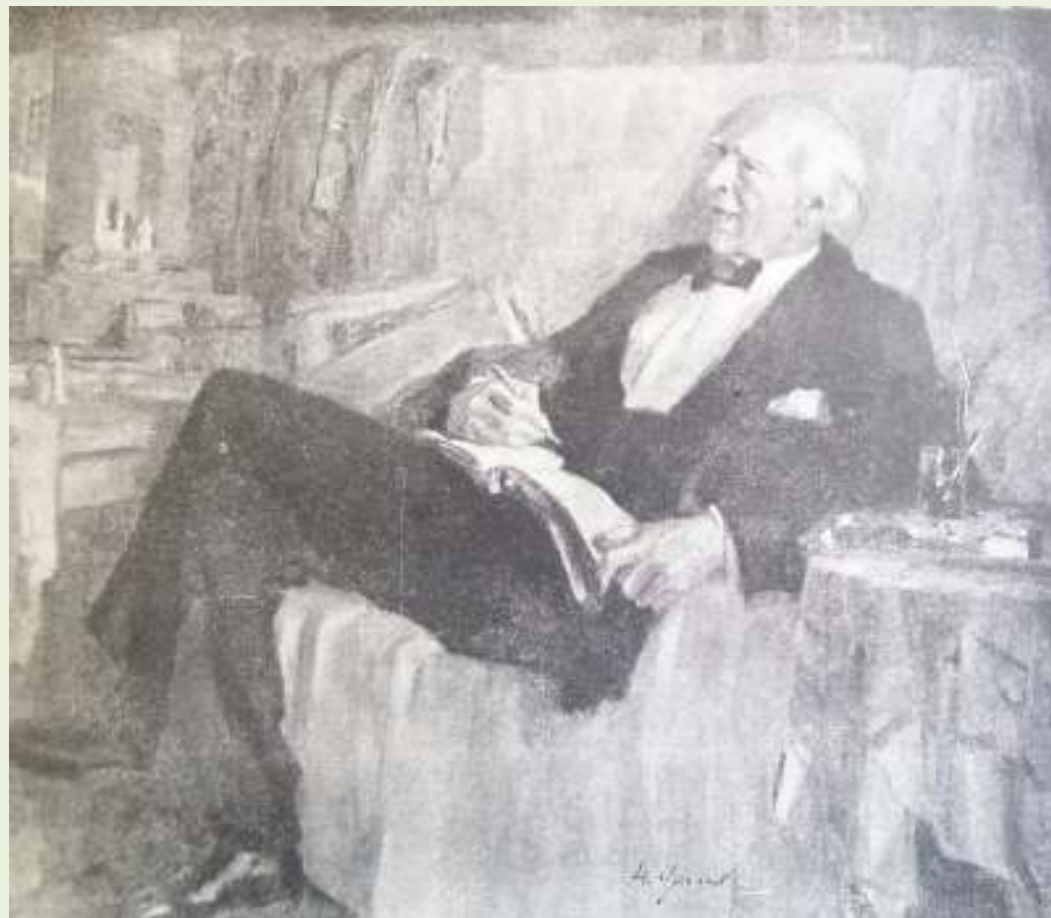
Н. Ульянов. Портрет К.С. Станиславского. (К.С. Станиславский за работой). 1947

Сталинская премия третьей степени (1948)