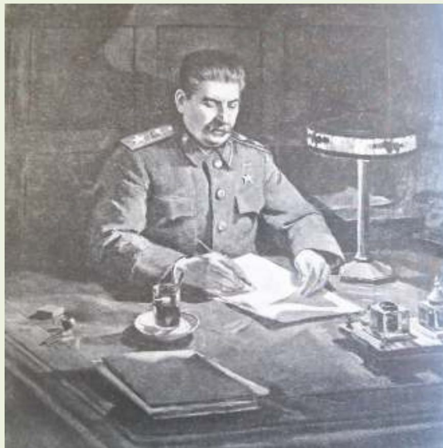
Д.Налбандян. Портрет И.В. Сталина. Масло. 1947