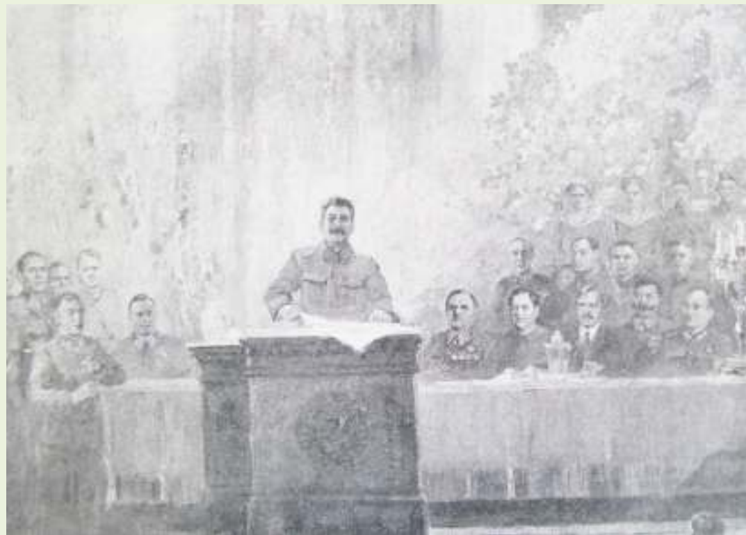
А. Герасимов. Гимн Октябрю. Фрагмент. Масло . 1942

«В Ваших рассуждениях, товарищ Фадеев, нет главного, нет марксистско-ленинского анализа задач, которые сейчас жизнь выдвигает перед литературными работниками, перед деятелями искусства[...]»