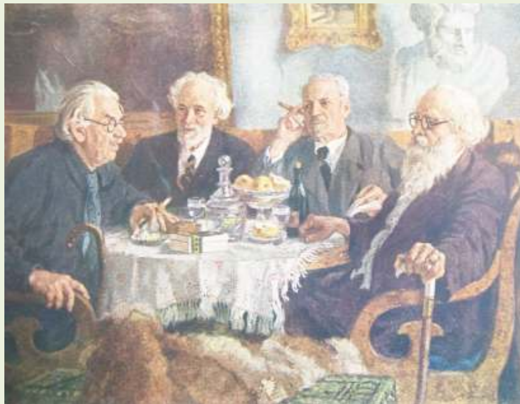
А.М. Герасимов «Портрет старейших художников» (И.Н.Павлова, В.Н.Бакшеева, В.К.Бялыницкого-Бирули, В.Н.Мешкова) (1944)