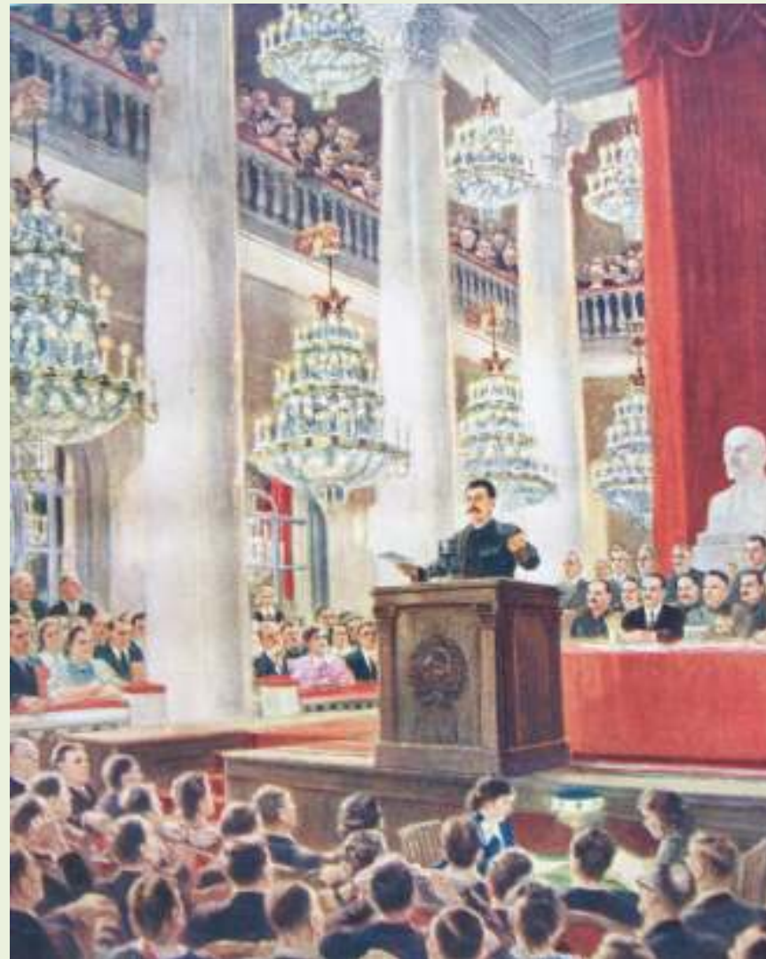
А. Герасимов. Есть метро! 1949