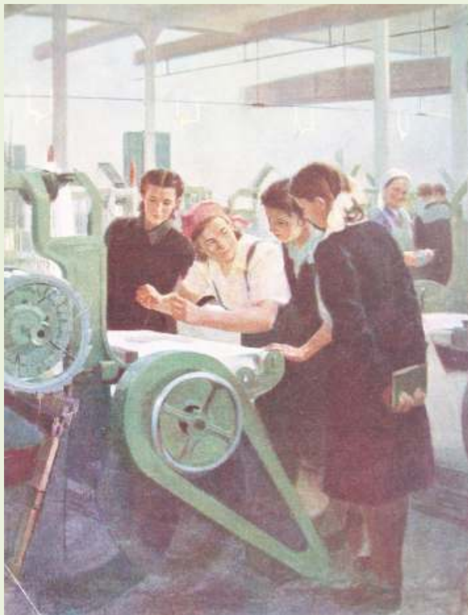
Н. Корчагин. Впервые. 1951