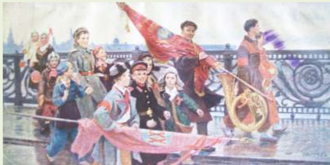
Д. Мочальский. Они видели Сталина. 1949